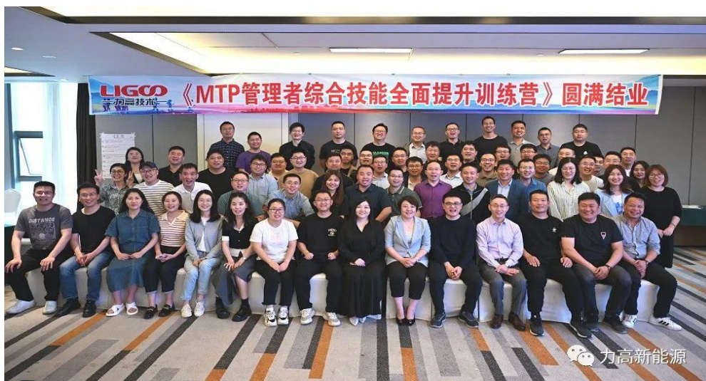
图三、管理者技能提升训练