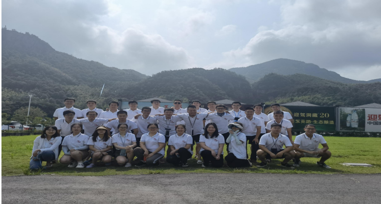
图四图五、团队建设