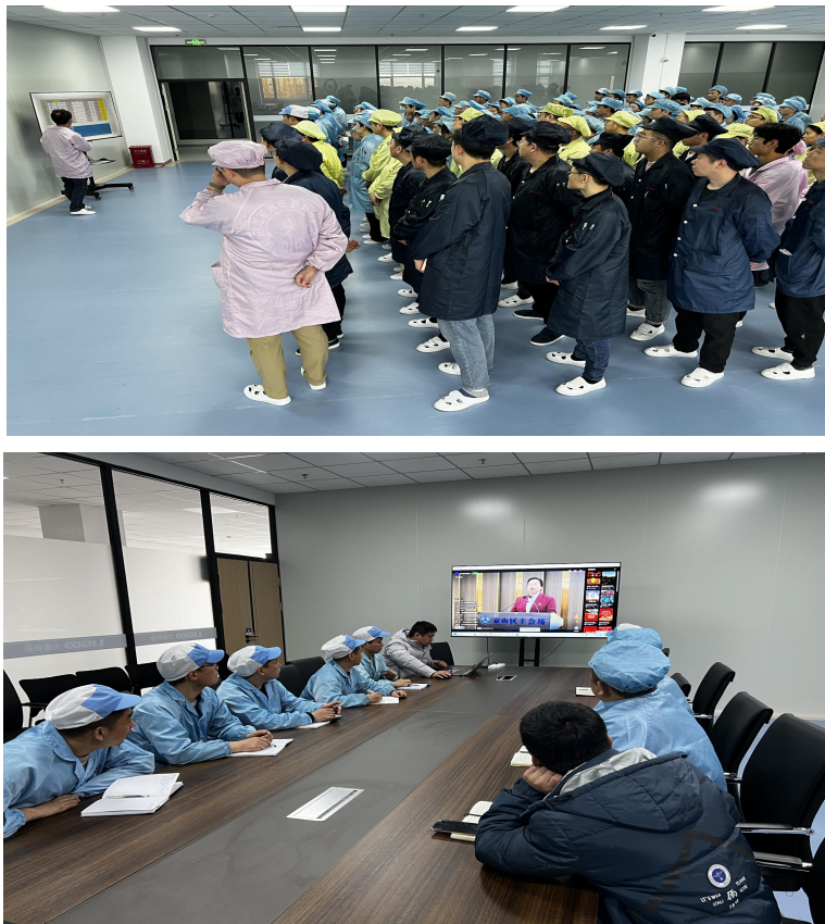
图一图二、 安全生产教育

公司高度重视员工的职业健康与安全，不断加强环境与职业健康安全管理工作。2023 年公司继续健全和完善职业健康安全体系和安全标准化工作，在职业健康安全制度建设、设备管理、员工健康、相关方安全管理、应急管理等方面全面对标。公司定期组织全员观看安全警示片、播放习惯性违章行为视频，通过全员、全方面的教育和宣贯，持续改进职业健康安全管理工作；使得“安全，不仅仅是一项工作，而应该成为一种工作方式，一种生活态度”的理念充分体现。